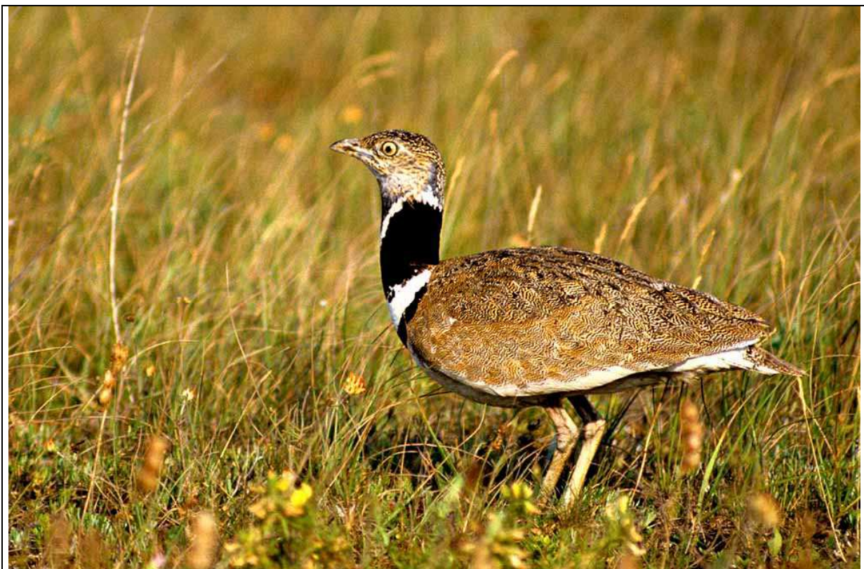
Les plaines d'Oiron Thénezay, du Mirebalais et du Neuvilleois jouent un rôle fondamental pour le maintien de la population migratrice d'Outarde canepetière nicheuse en Poitou-Charentes. Ces deux zones font partie du site Natura 2000 sur lequel est localisée l'Earl Gorin.

Le site d'exploitation est localisé dans un site Natura 2000, réseau européen de sites naturels qui vise à préserver des milieux naturels et des espèces animales et végétales devenues rares à l'échelle européenne, en tenant compte des exigences économiques, sociales, ainsi que des particularités locales. Ainsi, deux zones de protection spéciale Natura 2000 ont été déterminées : la plaine d'Oiron Thénezay, et les plaines du Mirebalais et du Neuvilleois.